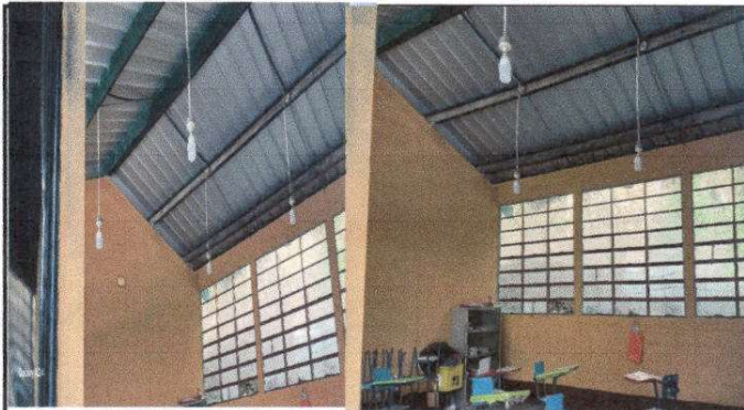
Foto 3: Finalización de pintura interna del edificio escolar y mejoramiento del sistema eléctrico.