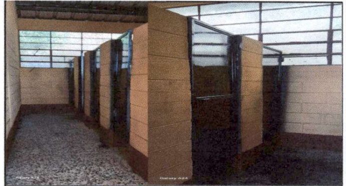
Foto 2: Finalización de Mantenimiento a estructura (aplicación de pintura) baños.