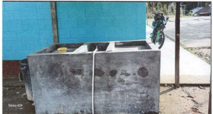
Foto 8: Finalización Sustitución de Pila de Cemento por uno de cemento.