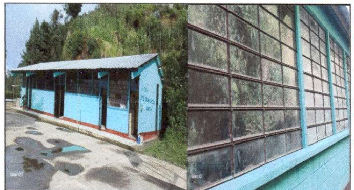
Foto 4: Finalización de Mantenimiento a estructura (aplicación de pintura) en parte externa del edificio.