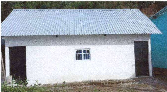
Foto 9: Finalización de repello y cernido de pared y, Sustitución de puertas de metal.