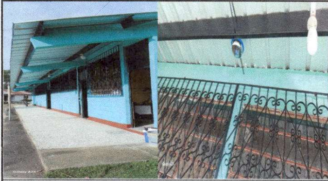
Foto1: Finalización de Pintura en la parte interna y externa de la escuela y, colocación de un Timbre.