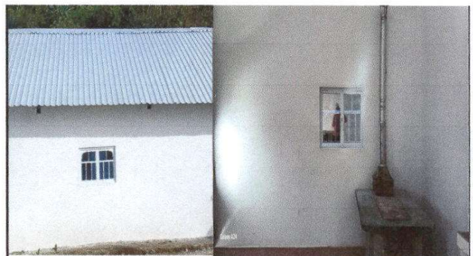
Foto 10: Finalización de Sustitución de ventana de madera por metal mas vidrio de 1 metro de ancho x 0.75 de altura.