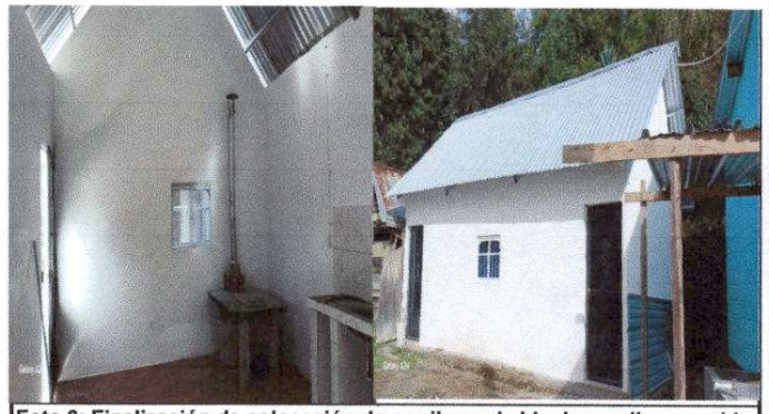
Foto 6: Finalización de colocación de carrileras de block, repello y cernido de pared y, Sustitución de estructura de soporte de madera por metal de 3x2 p y tubos galvanizados de 4x4 p.

Observación: Si es necesario se pueden agregar hojas adicionales y actualizar el número de hojas.