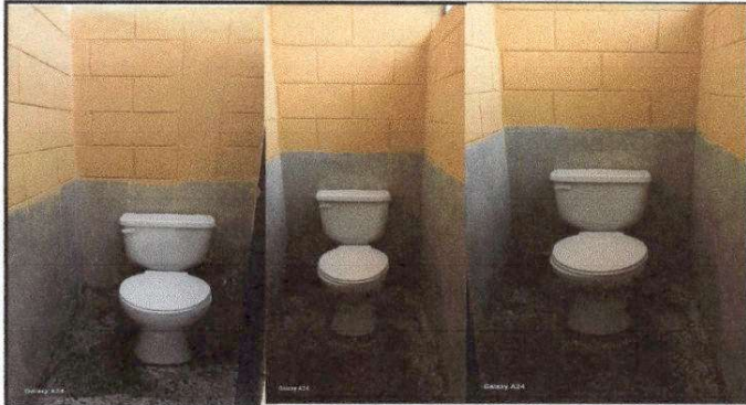
Foto7: Finalización de sustitución de inodoro.